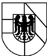
Landkreis Breisgau Hochschwarzwald